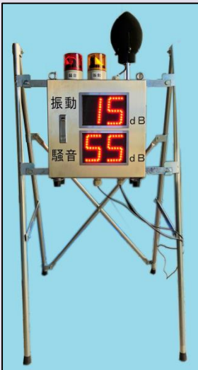
正面(簡易スタンド)